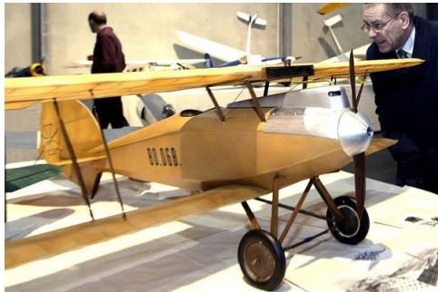
Vor allem originalgetreue Modelle älterer Flugzeuge sollen vom neuen Motor profitieren.